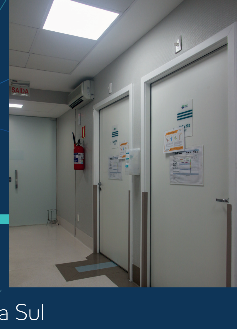
Centro de Transplante de Medula Óssea - Hospital Baía Sul